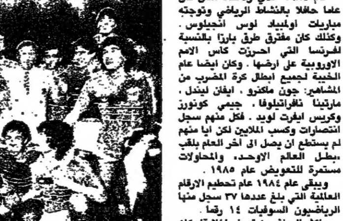
منتخب فرنسا حقيقياً بعمريه ميشال هيدالغو في صورة تذكارية بعد احراز كأس الامم الاوروبية ١٩٨٤